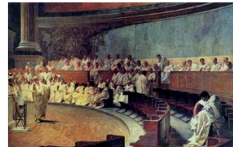
"L'orgoglio di essere cittadino romano" - Cicerone

"Duemila anni fa l'orgoglio più grande era poter dire Civis Romanus sum . Oggi, nel mondo libero, l'orgoglio più grande è dire "Ich bin ein Berliner" (io sono berlinese)". ●